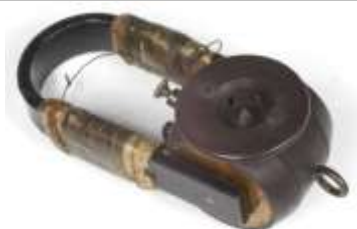
Auscultador usado por Marconi em Newfoundland, 1901, na primeira comunicação transatlântica / Headphone used by Marconi in Newfoundland , 1901, to receive first transatlantic communication.

No cinema, o drama do naufrágio do Titanic foi explorado já por 19 filmes. O mais conhecido, o filme Titanic, foi realizado em 1997 por James Cameron.