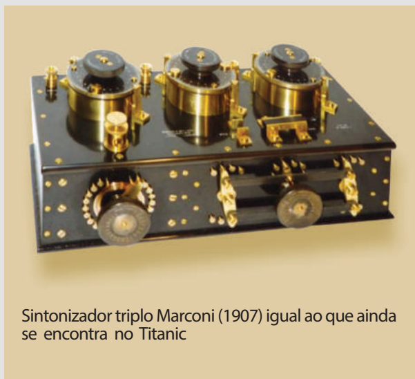
Sintonizador triplo Marconi (1907) igual ao que ainda se encontra no Titanic

Marconi evolved the concept of tuning his receivers and in 1907 produced the triple tuner that would be used on many ships and especially in Titanic. In 2020, there is a project to recover this historic device, which is still in the remains of the ship.