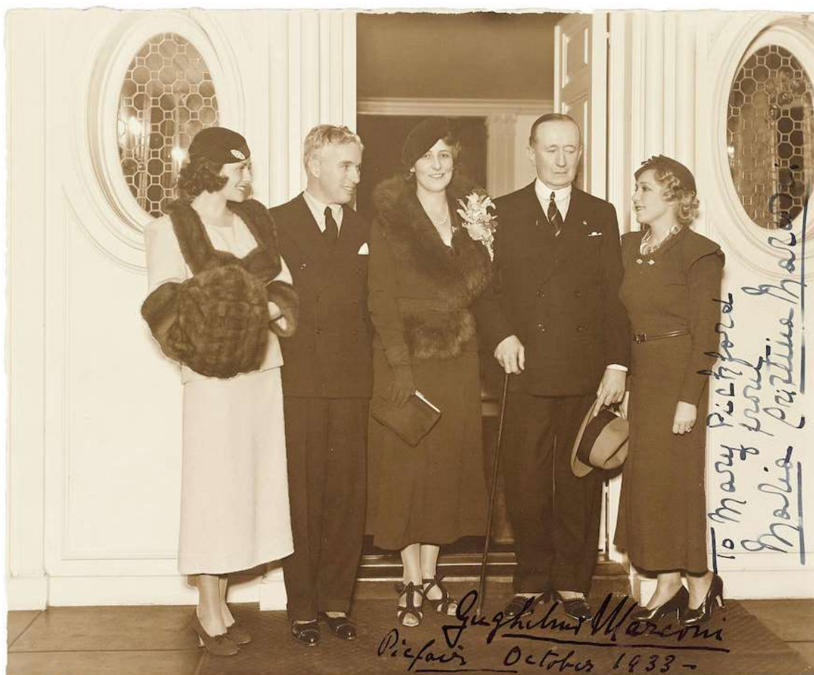
Fig. 13 - Paulette Godard, Charlie Chaplin, Princess Maria Cristina, Marconi e/ and Mary Pickford.