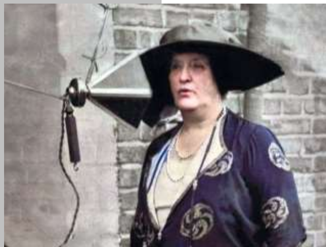
Fig. 9 - Dame Nellie Melba, Chelmsford, GB, Junho 1920. Marconi broadcasts the singer's performance / Marconi fez radiodifusão de atuação da cantora.

On June 20, 1922, at a lecture at American Radio Enginners in New York, in view of the experimental results he had, Marconi predicts the development of RADAR.