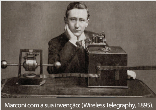
Marconi com a sua invenção: (Wireless Telegraphy, 1895).