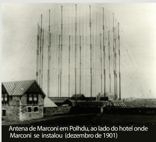
Antena de Marconi em Polhdu, ao lado do hotel onde Marconi se instalou (dezembro de 1901)

comunicação transatlântica fosse conseguida, o crédito seria atribuído a Marconi e não a Fleming, mas que este seria compensado com 500 ações da Marconi Company. Fleming manteve-se na Marconi até 1930. Durante esse período, os direitos da sua invenção do díodo de vácuo, decorrentes dos trabalhos efetuados sobre o efeito Edison [H4] na empresa de Edison em Inglaterra, foram passados para Marconi [R2]. Esta apropriação de direitos por Marconi sobre a nova válvula eletrônica (díodo de vácuo) viria a ser usada contra o inventor do tríodo eletrônico, Lee de Forest, na década de 1919-1920, altura em que o poderio económico e a astúcia de Marconi lhe foram favoráveis no conflito que se desenrolou nos tribunais dos EUA.