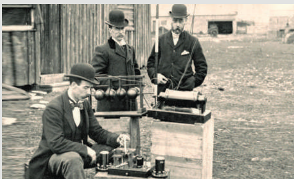
[H3] - Marconi, à esquerda, em testes no BPO usando o oscilador de Righi em 1897)

Marconi tinha uma paixão enorme pelo mar. O seu instinto levou-o rapidamente a concluir que os sistemas de rádio seriam fundamentais para aumentar a segurança marítima, o que seria uma oportunidade para um negócio de valor incalculável. Surgiu assim a ideia de realizar uma comunicação de rádio transatlântica. Em dezembro de 1897, Marconi montou uma estação de telegrafia sem fios na ilha de Wight, que permitiu à rainha Victoria enviar mensagens para o príncipe Edward, seu filho, que estava no mar a bordo do iate real. Em dezembro de 1898, Marconi fundou a primeira empresa no mundo exclusivamente dedicada à fabricação de