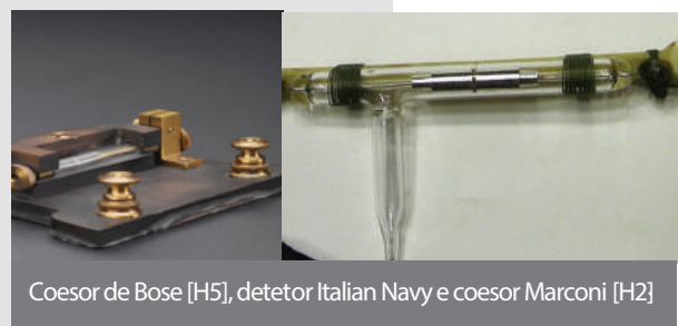
Coesor de Bose [H5], detetor Italian Navy e coesor Marconi [H2]