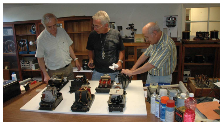
Muitas das peças em exposição precisam de arranjo e manutenção. O objetivo é que fique tudo a funcionar até Outubro.