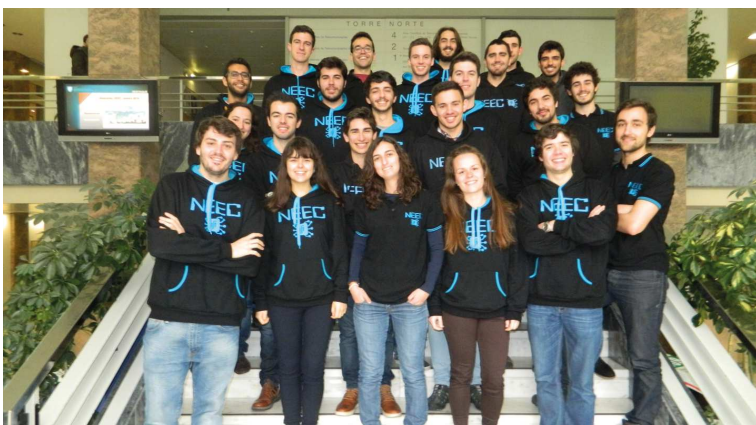
A equipa NEECIST pousa para uma última fotografia de equipa após mais um ano letivo recheado de atividades.

Sempre tendo em mente o interesse dos alunos do MEEC e a necessidade de enriquecer o seu currículo enquanto estudantes, a equipa do NEEC compromete-se assim a encarar o próximo ano letivo com o mesmo empenho e dedicação, e com a ambição de quem quer voltar a elevar a fasquia. Cá estaremos em Setembro, com uma equipa reforçada e muitas surpresas. Até lá!