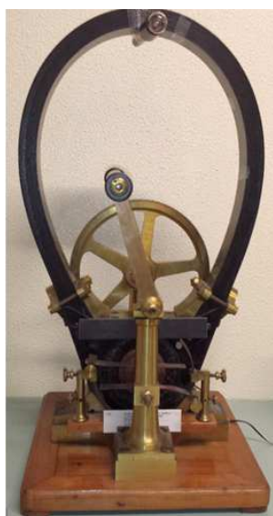
Algumas das peças que estarão disponíveis no museu, um telefone Gower-Bell de 1882 (à esquerda) e um gerador de Gramme de 1879 (à direita).