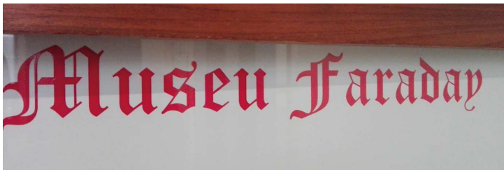
Logótipo do futuro museu Faraday.